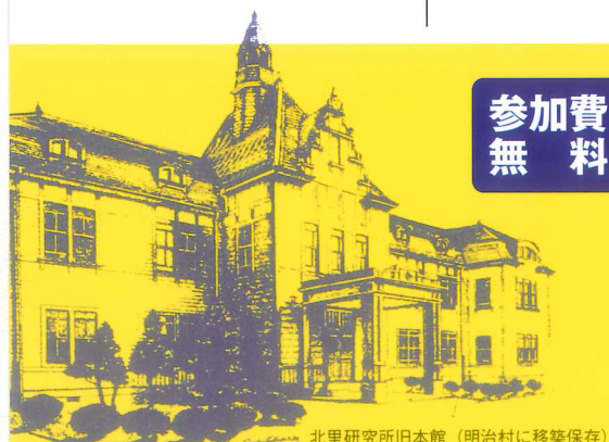
北里研究所旧本館 (明治村に移築保存)